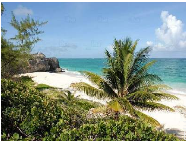
accesso diretto alla spiaggia