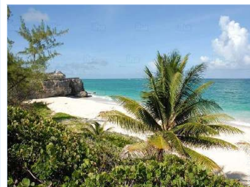
accesso diretto alla spiaggia