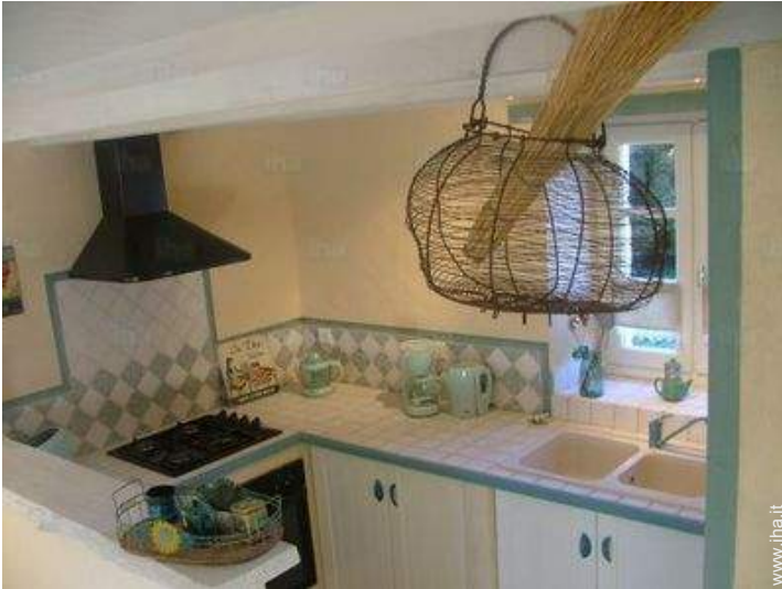
cucina in stile americano