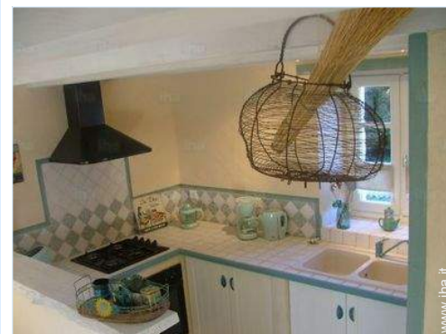
cucina in stile americano

Villaggio centro 3km Panetteria 3km Negozi tipici 3km Supermercato 3km Salone di coiffure 1km Ufficio postale 1km