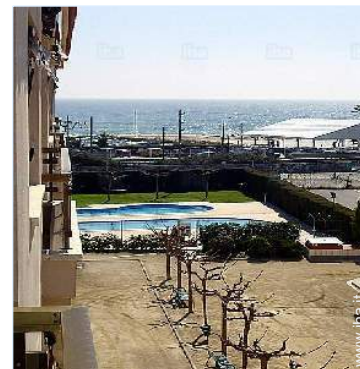
vista dal terrazzo