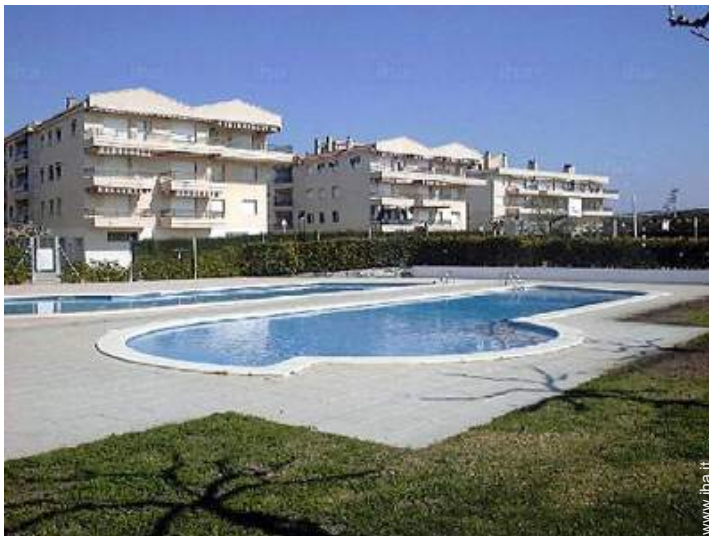
vista dalla piscina