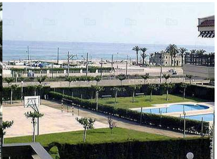
vista dalla proprietà