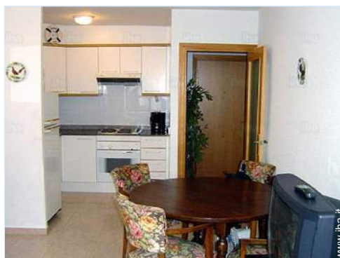
cucina in stile americano

Accesso sedia a rotelle Dotazioni per i diversamente abili : motoria, visiva, auditiva