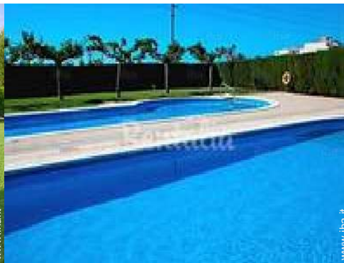
vista sulla piscina