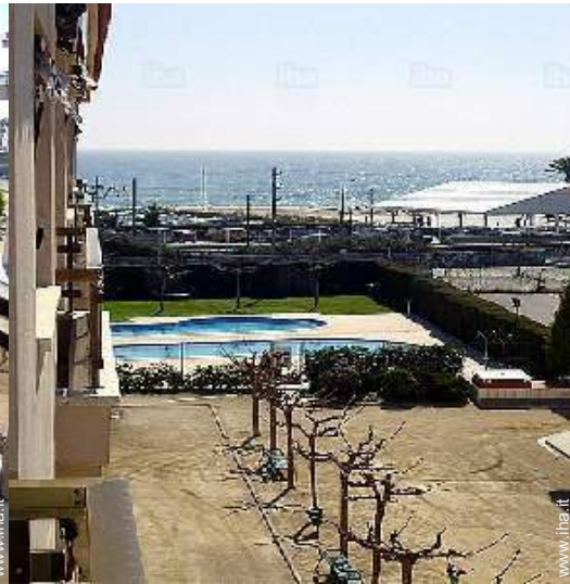
vista dal terrazzo