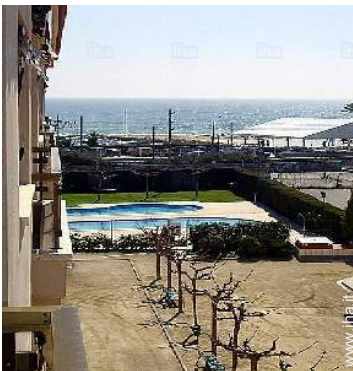
vista dal terrazzo