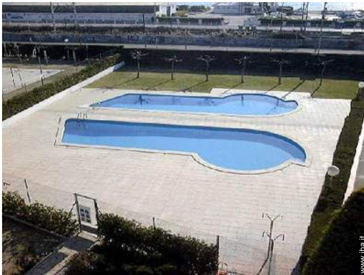
piscina in comune