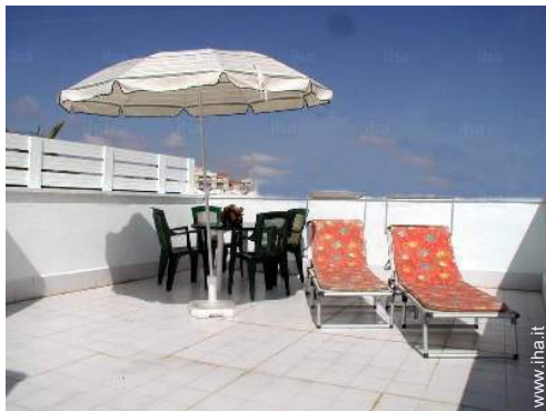
terrazzo sul tetto