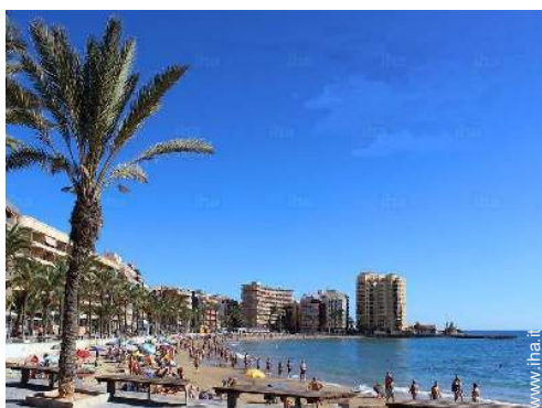
accesso diretto alla spiaggia