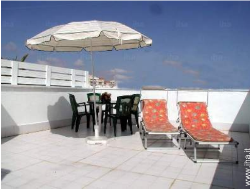
terrazzo sul tetto