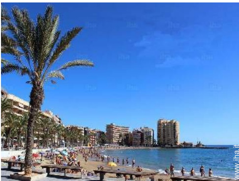
accesso diretto alla spiaggia