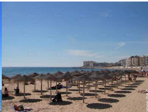
attività balneari nelle vicinanze