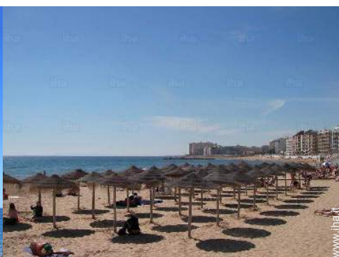
attività balneari nelle vicinanze