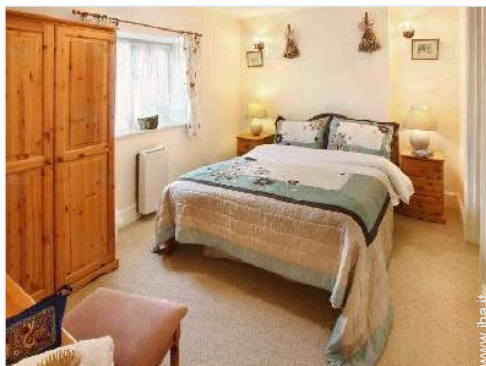
stanza degli ospiti