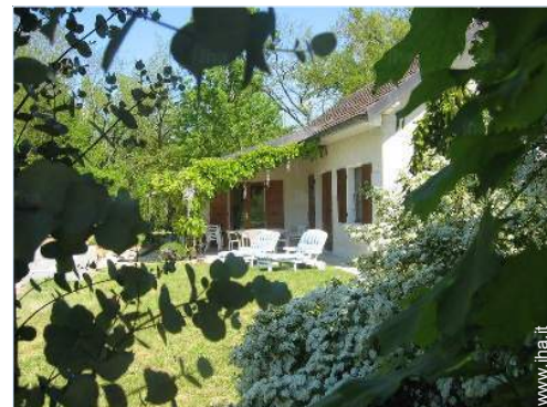
vista dal giardino/parco