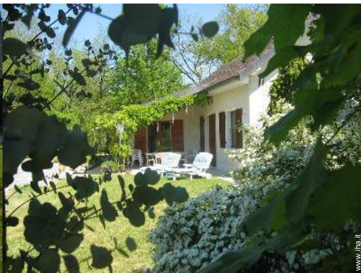
vista dal giardino/parco