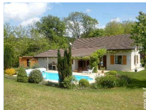
vista dal giardino/parco

Negozi di alta classe e di lusso 20km Salone di coiffure 2,5km Ufficio postale 2,5km Banca 7,5km Distributore automatico di biglietti 7,5km Farmacia 2,5km Medico 2,5km Infermiera 2,5km Ospedale 20km