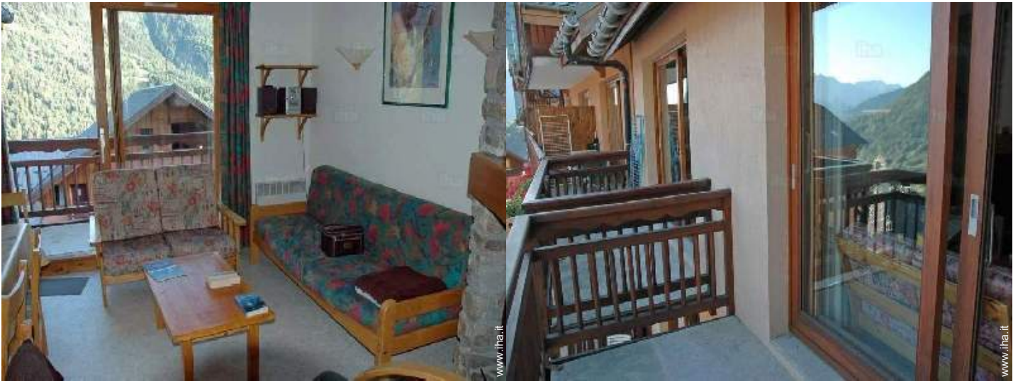
vista dal balcone