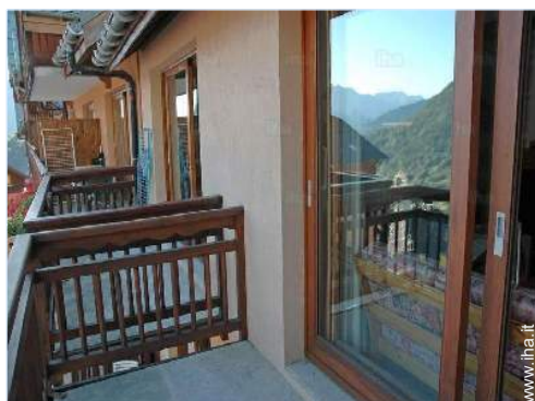
vista dal balcone