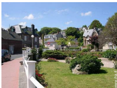
vista sul centro del paese