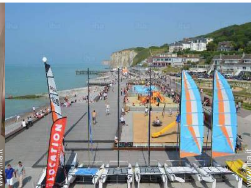
attività balneari nelle vicinanze