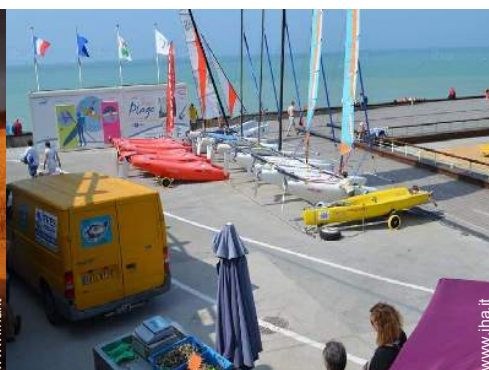
sport acquatici nelle vicinanze