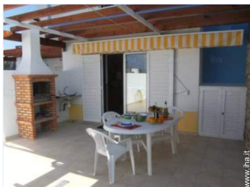
camera dei bambini