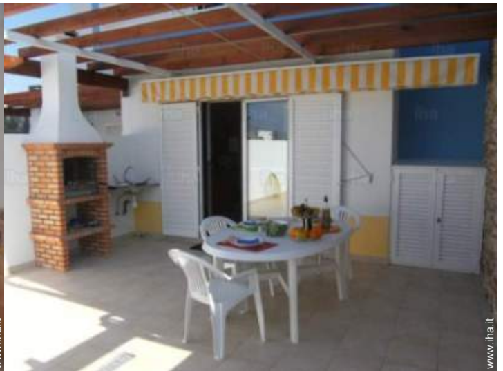
camera dei bambini