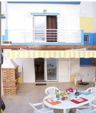
vista dal terrazzo