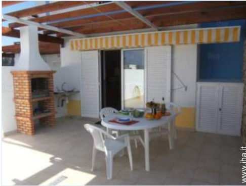
camera dei bambini