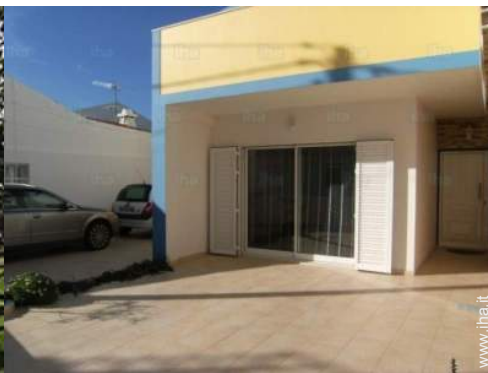
vista dal salone