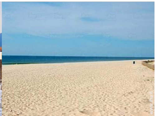
luogo per bagnarsi