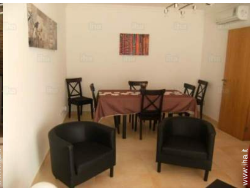
sala da pranzo