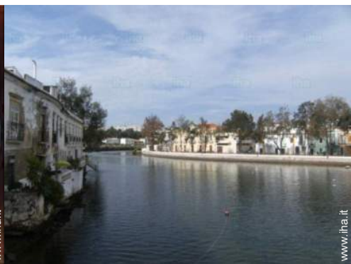
Città nelle vicinanze