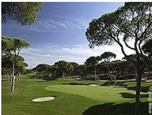
percorso di golf 18 buche