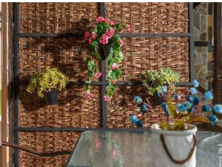
vista dal balcone