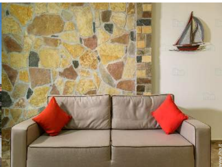
divano(i) letto 2 pers