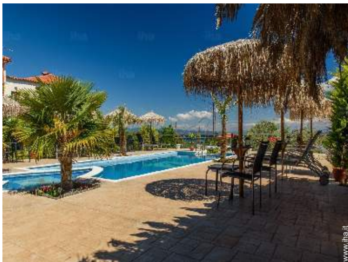
vista dalla piscina