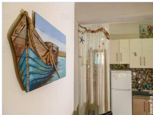
vista dalla cucina