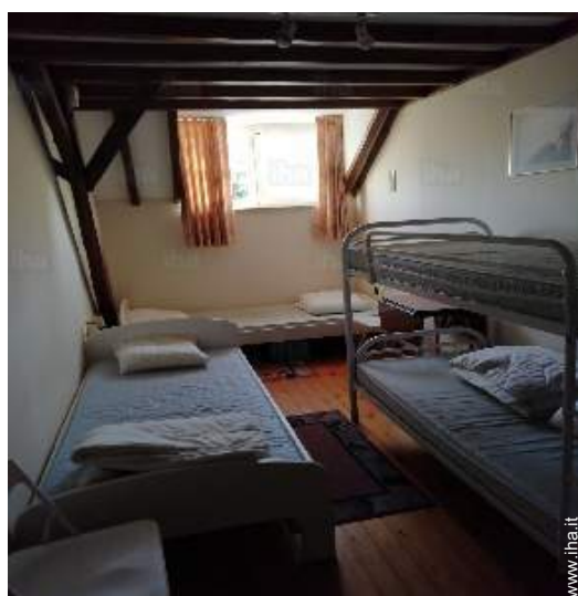
camera per ragazzi