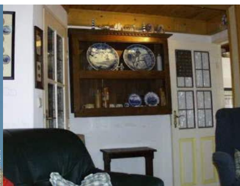
Disposizione interna e comfort