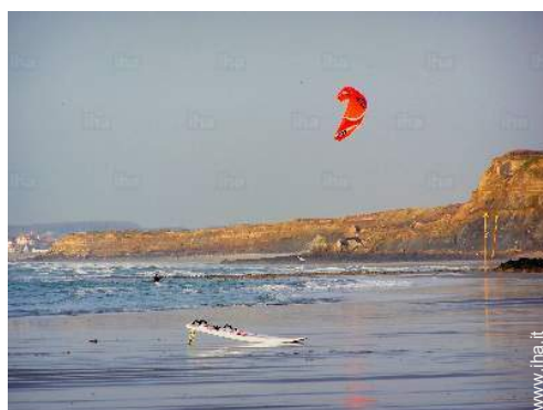
punto di windsurf