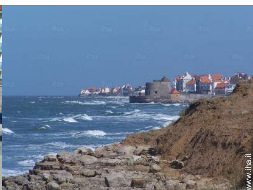
Città nelle vicinanze