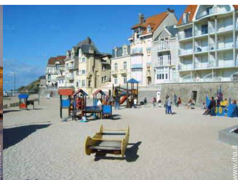
Attrazioni e relax