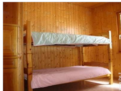
letti a castello

Villaggio centro 1,5km Panetteria 1,5km Traiteur 1,5km Ufficio postale 1,5km Distributore automatico di biglietti 1,5km Farmacia 1,5km Medico 1,5km