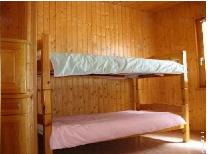
letti a castello