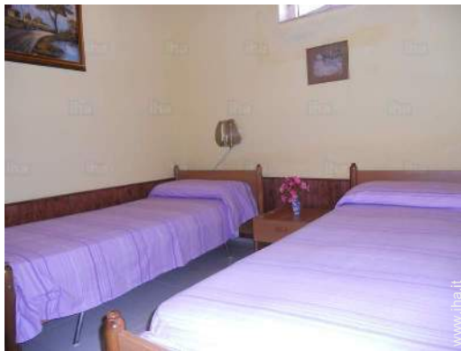
camera per ragazzi