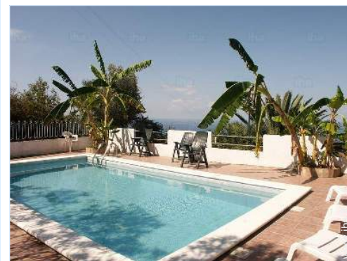
vista dalla piscina