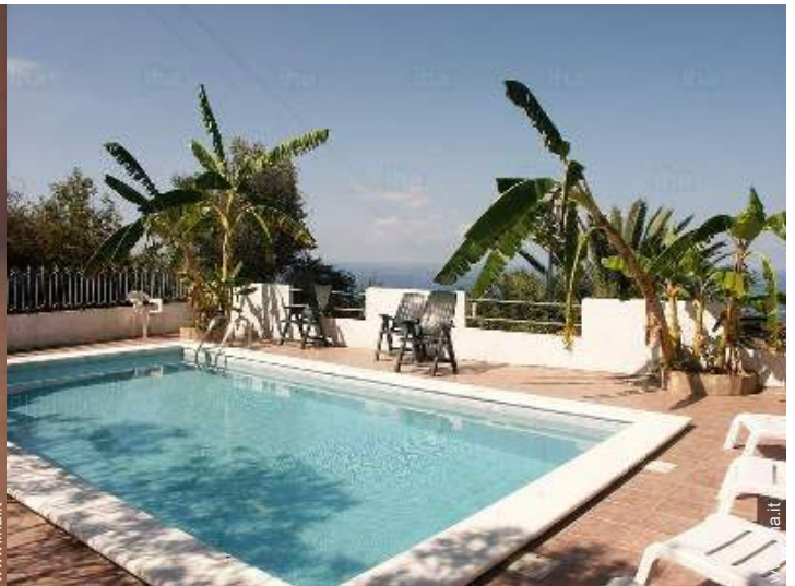
vista dalla piscina