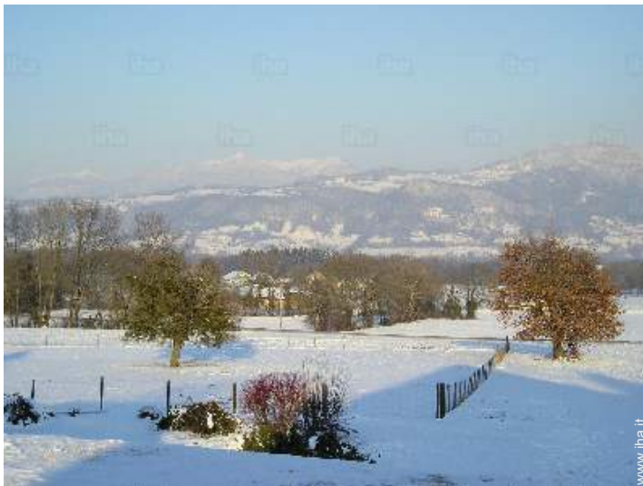
vista sulla campagna