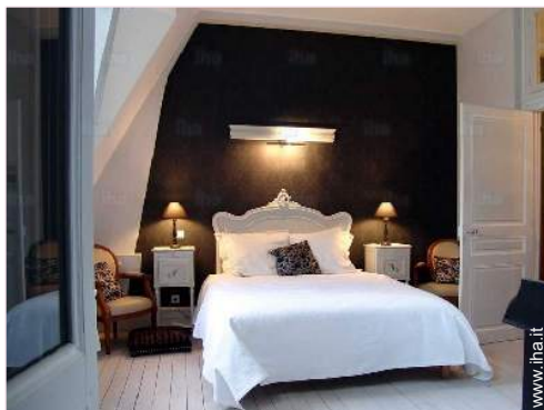
La camera degli ospiti