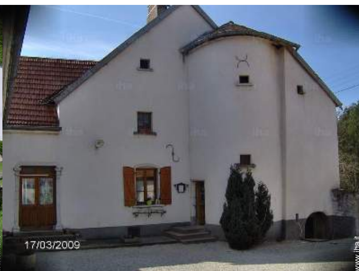
Casa in Pietra