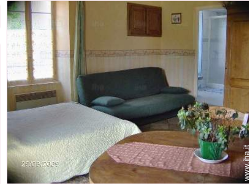
La camera degli ospiti