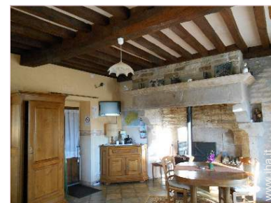
La camera degli ospiti