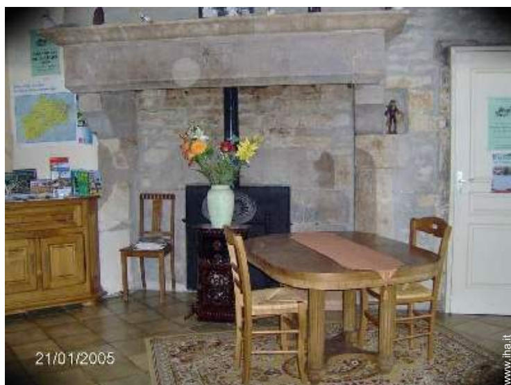
La camera degli ospiti