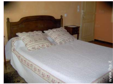
La camera degli ospiti