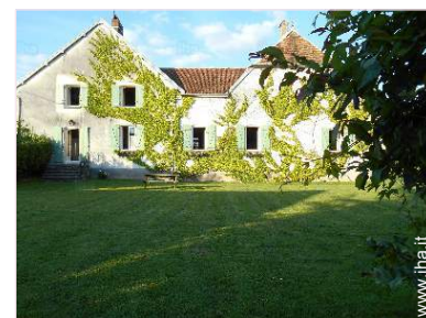
vista sul giardino/parco