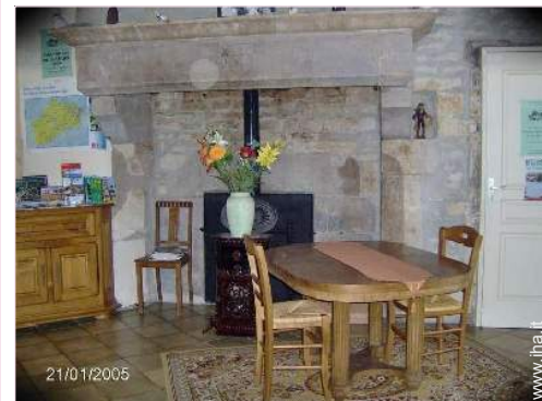
La camera degli ospiti