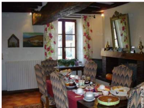
Sistemazione interna a disposizione degli ospiti