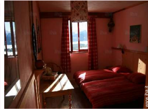
La camera degli ospiti