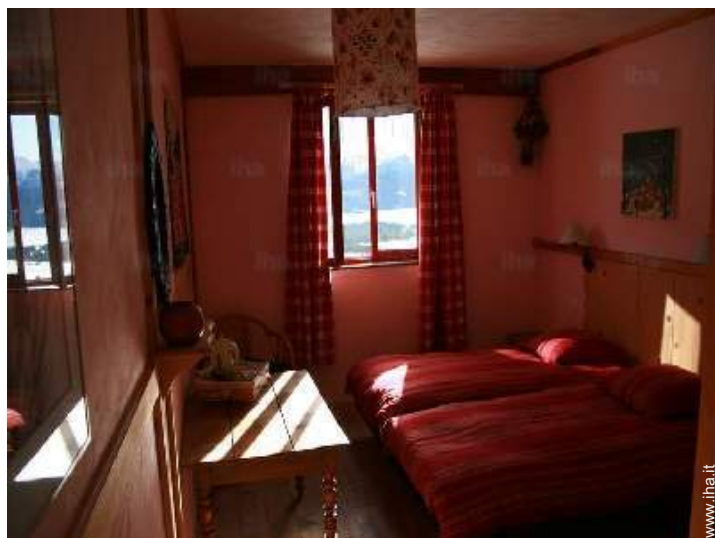
La camera degli ospiti