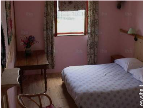
La camera degli ospiti