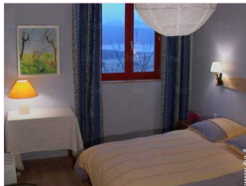
La camera degli ospiti