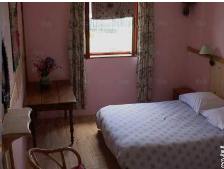
La camera degli ospiti