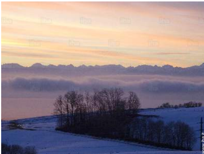
vista dal giardino/parco