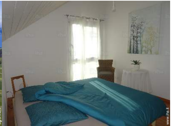
La camera degli ospiti