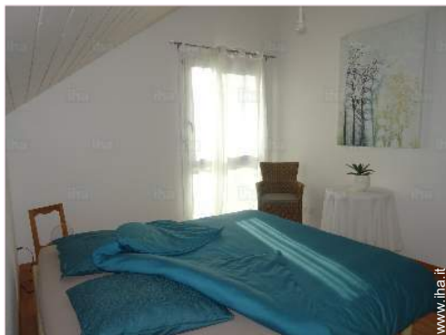
La camera degli ospiti