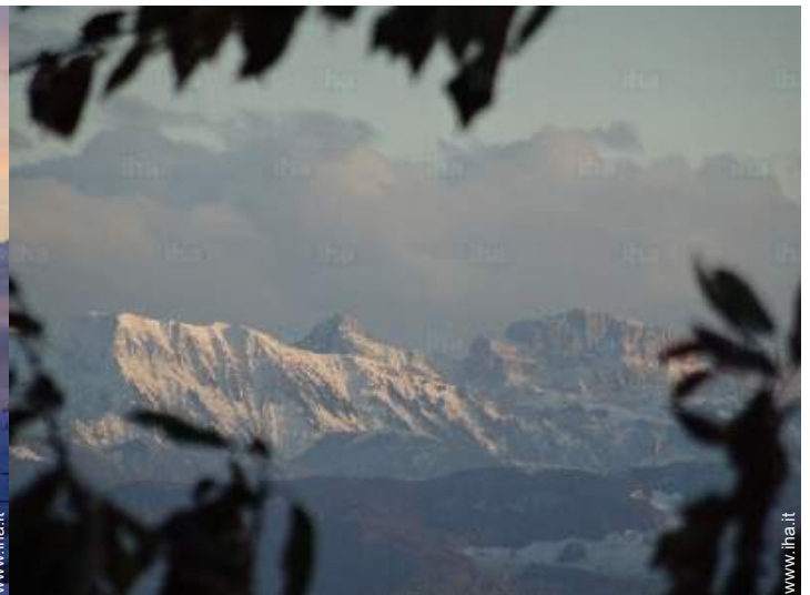
vista sulla montagna