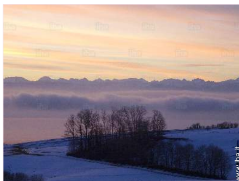
vista dal giardino/parco

Presenza sul posto : animali domestici Affitto non fumatori